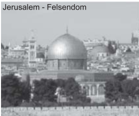
Jerusalem - Felsendom