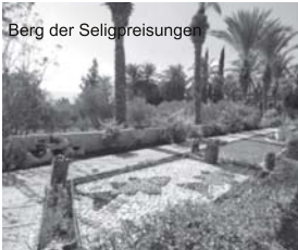
Berg der Seligpreisungen

Flugreise mit der Lufthansa ab/bis Bremen vom 29.03. bis 05.04.2023